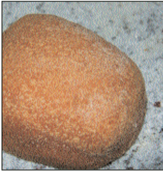
Anuga FoodTec Technologiekick