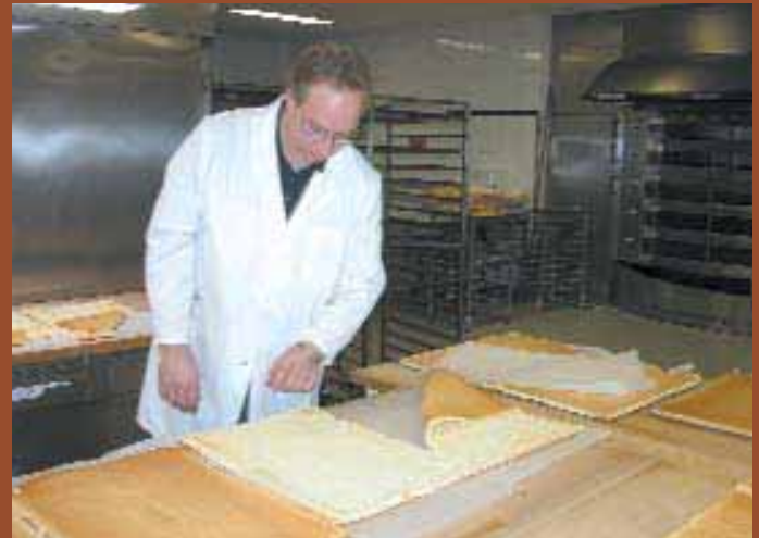
Mit kritischem Blick wurde jede Probe genau betrachtet.

Luft entweicht und entsprechend das Volumen beim Gebäck reduziert wird. Die Konsistenz und Streichfähigkeit einer Biskuitmasse ist maßgeblich abhängig davon, wie lange aufgeschlagen wird und lässt sich somit bei den meisten Produkten spezifisch auf Anwendung bzw. Anlage einstellen. Diese Option kann allen Produkten uneingeschränkt zugesprochen werden. Die stark unterschiedlichen Aufschlagzeiten von 4 – 10 Minuten im Mittel sind auf die unterschiedliche Komposition und Dosierung der Aufschlagemulgatoren zurückführbar. Die Erfahrung zeigte, dass Litergewichte zwischen 350 und 400 g zum Ende der Aufschlagzeit ein gutes bis sehr gutes Ergebnis beim Endprodukt erwarten lassen.