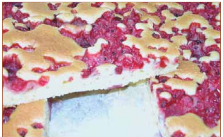
Ein gelungenes Beispiel für gute Tragfähigkeit der Rührmasse: Die Früchte sind nicht bis zum Boden gesunken und auch der Fruchtsaft ist weitgehend noch in den Kirschen und Beeren.

Bei der Massenkonsistenz stellte sich eine Dreiteilung dar. Einige wenige Massen waren eher fließend und ließen sich demzufolge auch leichter aufstreichen, aber auch schwerer mit dem Spritzbeutel exakt in Förmchen für Muffins dosieren. Das Gros der Massen hatte