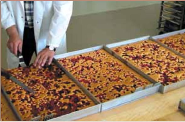
Gleiche Mengen an Früchten als Auflage und dennoch so unterschiedliche Ergebnisse.

eine eher zähe Konsistenz und einige wenige waren überdurchschnittlich fest. Wer meint, es bestehe ein direkter Zusammenhang zwischen Massenfestigkeit und Tragfähigkeit, je fester eine Masse ist, desto besser müsste sie eigentlich Früchte tragen können, wurde teilweise eines Besseren belehrt. Offensichtlich führt die Hitze des Ofens selbst bei festeren Massen zu deren Erweichung, was in der Folge auch ein Einsinken der Früchte ermöglichte.