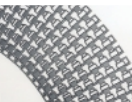
Band Multi Curve

Ob die Anlage läuft oder steht, hängt nicht selten von der Qualität der Transportbänder ab. Die niederländische Unternehmensgruppe Kaak verlässt sich deshalb grundsätzlich auf Spezialbänder, die eigens für die Gruppe hergestellt werden.