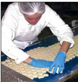
Fornetti 4.600 Shops im System