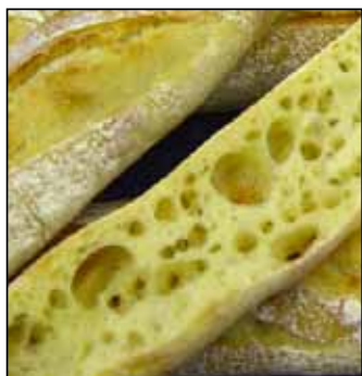
Benier Neuer Langroller