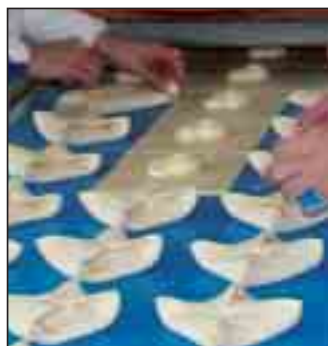
Produktion Guschlbauer Backwaren