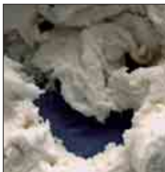
Forschung Glutenfreie Backwaren