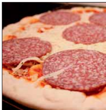
Pizza Markt und Technik