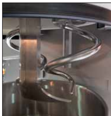
iba 2009 Messe und Neuheiten