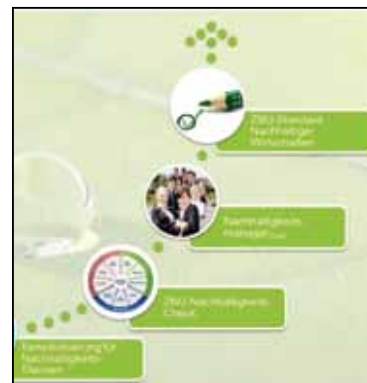
Nachhaltigkeit Praktische Umsetzung