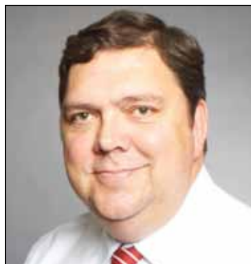
IFS Pilotprojekt läuft