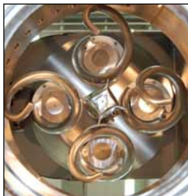
iba 2012 Nachbericht und Neuheiten