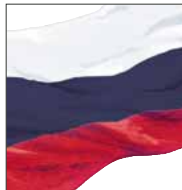
Kooperation Wachtel + Heuft in Russland