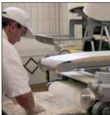
Brotanlagen Maßgeschneiderte Automatisation