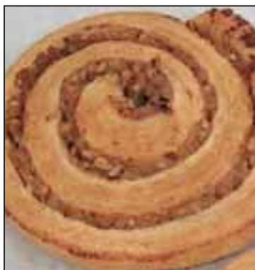
Test 23 Nussfüllungen geprüft