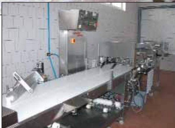
Auf der Rondo-Doge-Feingebäckanlage werden 15 verschiedene Produkte hergestellt.