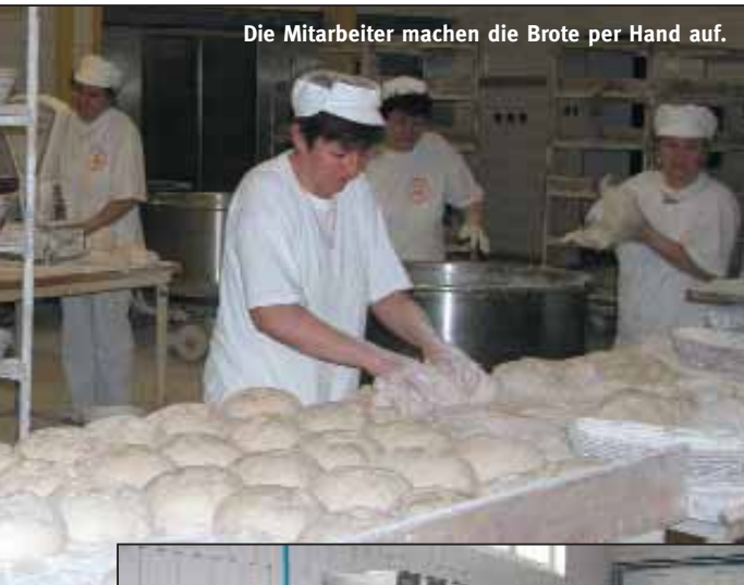
Die Mitarbeiter machen die Brote per Hand auf.